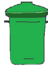
70 Liter max. 25 kg