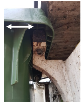
Aufnahme des Behälters am Kehrrechtswagen (Breite 3.5 cm)

Für halbgefüllte Behältnisse (Qualität vor Quantität) verwenden Sie bitte eine Gebührenmarke der nächsttieferen Kategorie, z. B. für ein halb volles 240 L-Behältnis eine Gebührenmarke für ein 140 L-Behältnis. Seit 2015 behält sich die Gemeinde Muhen vor, nur noch Gartenabfälle in den offiziell genehmigten Gebindeformen und -größen abzu-transportieren (siehe Abbildung oben).